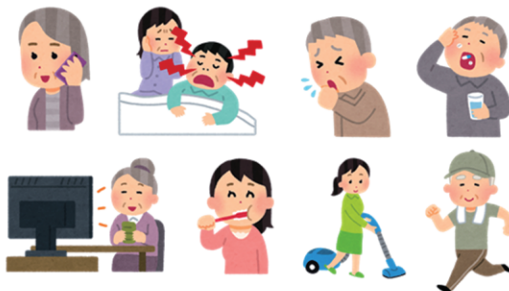
「話すこと」「食べること」を中心に、人間の様々な行動を音で捉えます

また、非侵襲で簡便なセンサーデバイスの開発や、適切な信号処理と深層学習に基づく高度な識別手法の研究、さらにはスマホベースの簡便なアプリの提供からクラウドによる高度な情報分析システムの構築に至るまで、主に医療・介護分野での音情報の様々な応用を想定して研究開発を進めており、障害者・高齢者が失った機能を回復するための人間拡張の研究にも取り組んでいます。