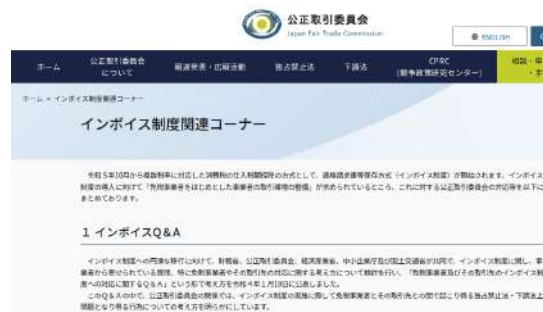
公正取引委員会ウェブサイト