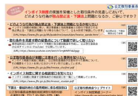
インボイスQ&Aの案内紙