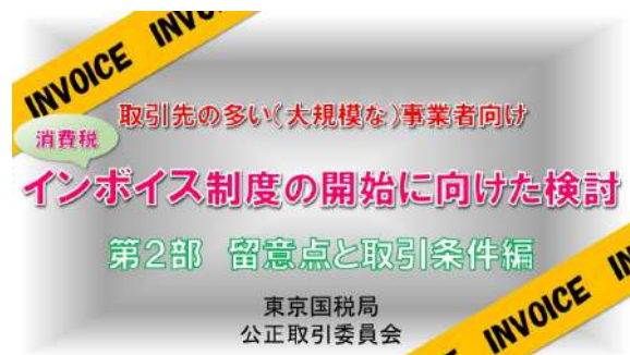
インボイスQ&Aの説明動画