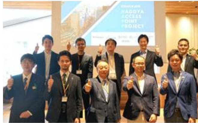
2021.4.7 NAPPキックオフイベント