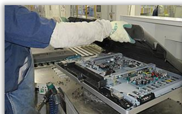
液晶テレビの解体