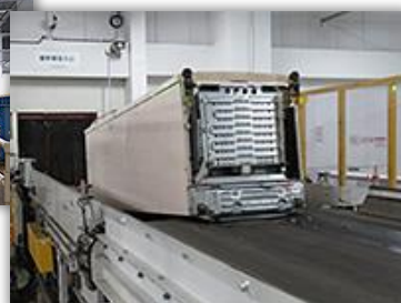
冷蔵庫は筐体ごと破碎機へ