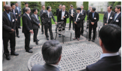
第1回国際交流懇談会の様子(P4)