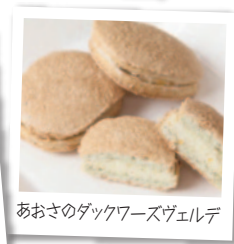
あおさのダックワーズヴェルデ