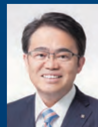
大村 秀章 愛知県知事