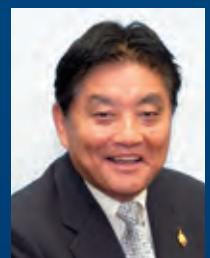
河村 たかし 名古屋市長

主催：愛知・名古屋産業立地プロモーション事業実行委員会(構成：愛知県、名古屋市)